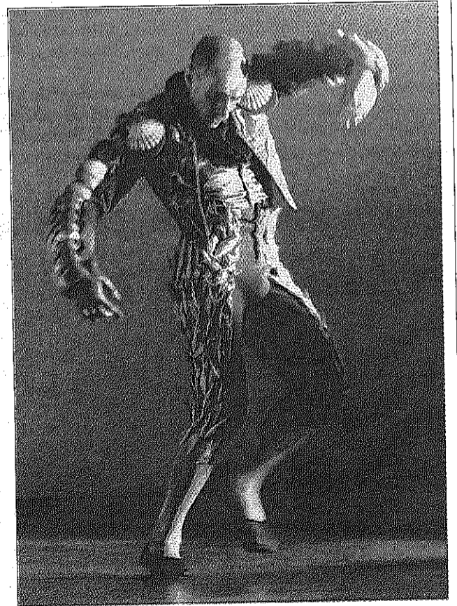
'Belmonte', la creació de Gelabert i Azzopardi que obrirà al novembre la Fira Mediterrània de Manresa ■ ROS RIBAS

Amb el moviment com a leitmotiv de molts dels 108 espectacles de teatre, dansa, música i circ —25 dels quals, d'estrena absoluta— que es podran veure del 3 al 7 de novembre en 31 espais de la capital del Bages, la Fira Mediterrània proposa també actuacions de la companyia Somorrostro Dansa Flamenca, el ballarí turc Ziya Azazi i la cantant Rim Banna. ■