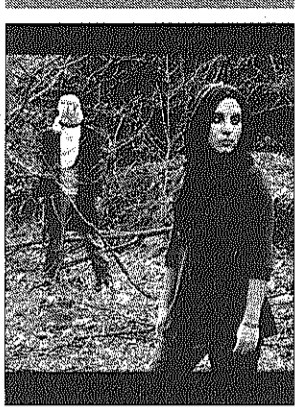
Fotograma d'"El pantano", que havia d'obrir la mostra