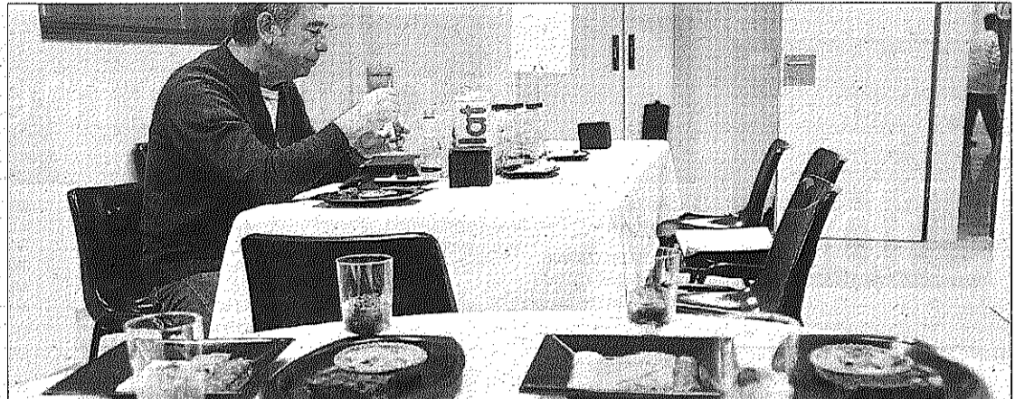
Un dels donants tastant el menú sibarita a l'Hospital Sant Joan de Déu. En primer terme, els plats

A la FUB, el Banc de Sang de Manresa va organitzar la marató, que va tenir un èxit rotund tant per la participació com per, sobretot, el fet que el 40% dels voluntaris que van donar sang ho feien per primera vegada, que era el gran objectiu dels organitzadors. La majoria eren joves estudiants dels centres universitaris de Manresa.