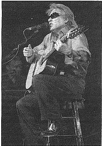
José Feliciano, en el Palau.

Sin duda José Feliciano es de los que defienden que la nostalgia no es un error. Y razón no debe de faltarle, como mínimo en la ciudad de Barcelona, en la que cada vez es más numeroso el público que le acompaña en esa afirmación. En sus últimas visitas Feliciano había actuado en locales de aforo reducido, pero esta vez, de la mano del Festival del Mil.lenni, llenó un Palau con todos los honores, es decir, con un público entregado como pocos y que —mucho más importante— disfrutó de lo lindo con todas las diabluras del invidente puertorriqueño. Y disfrutar es poco porque hasta rieron con sus chistes malos malísimos, incluidos los de ciegos que, ya se sabe, a todo ciego le encanta explicar.