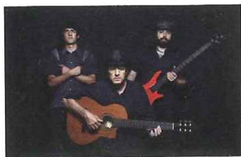
ESTEM SALVATS!

Fins al 18 de març hi ha temps per presentar propostes a la Fira Mediterrània d'Espectacles d'Arrel, que se celebrarà com cada any a Manresa del 3 al 6 de novembre.