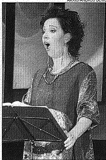
La soprano Cecília Lavilla Berganza

El punt i final al cicle de Música Sacra el posarà el Rèquiem de