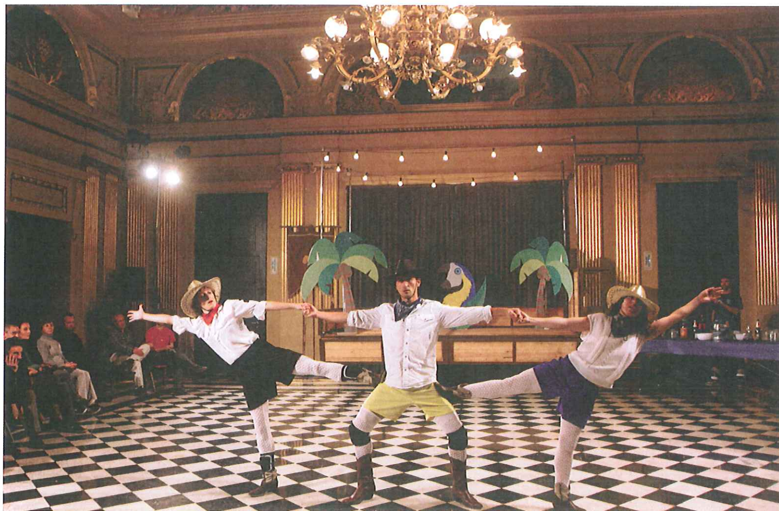
Espectacles: Àcid Folklòric , de la Societat Doctor Alonso