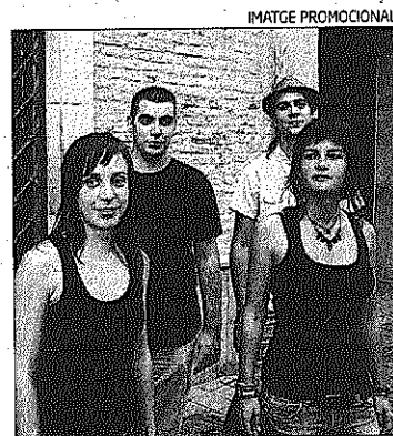
Integrants de Naia

► Riu, Naia, Katroi Ensemble i Borinots Tres Quar-trance actuaran a la final, el 3 de novembre per la fira