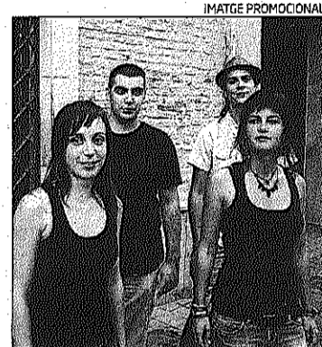
Integrants de Naia

▶ Riu, Naia, Katroi Ensemble i Borinots Tres Quar-trance actuaran a la final, el 3 de novembre per la fira