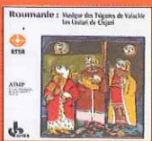
Roumanie: Les Lautari de Clejani / Musique des Tziganes de Valachie (Ocora / Radio France, 1986)

Si bé els discos de la formació sempre han ofert una bona qualitat de so i una descàrrega d'energia, és a l'escenari on els components s'entreguen completament. Aquesta edició en format de DVD inclou un concert realitzat a Londres —actuació que ocupa també el CD—, un extens documental filmat a Romania, entrevistes amb el grup i amb alguns dels seus seguidors més populars (entre ells l'actor nord-americà Johnny Depp) i material d'arxiu inèdit enregistrat durant les gires.