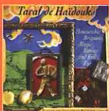
Honourable Brigands, Magic Horses and Evil Eye (Crammed Discs, 1994)

És el disc amb què el grup va iniciar la projecció internacional, després d'haver-se presentat tres anys abans amb un treball amb un títol tan dispers i poc explícit com Musique des tziganes de Roumanie (Crammed Discs, 1991). Va sorprendre per les seves dinàmiques peces d'estil geamparale i turceasca —amb influències de ritmes búlgars i turcs respectivament—, i inclou temes com "Cintec de Dragoste si joc" o "Briu", que s'han convertit en clàssics del seu repertori.