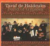
Band of Gypsies (Crammed Discs, 2001)

És el disc amb què el grup va iniciar la projecció internacional, després d'haver-se presentat tres anys abans amb un treball amb un títol tan dispers i poc explícit com Musique des tziganes de Roumanie (Crammed Discs, 1991). Va sorprendre per les seves dinàmiques peces d'estil geamparale i turceasca —amb influències de ritmes búlgars i turcs respectivament—, i inclou temes com "Cintec de Dragoste si joc" o "Briu", que s'han convertit en clàssics del seu repertori.